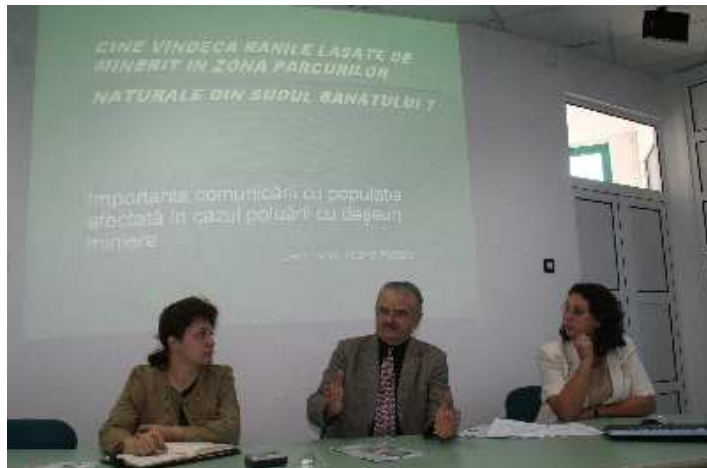
Prezentarea PLAIMDM în 8 Octombrie 2009 la sediul APM Caraș Severin

(PLAIMDM), prin care trebuie să se dea un răspuns credibil cetățenilor din comunitățile locale de pe teritoriul României și Serbiei privind perspectiva diminuării și stopării poluării cu deșeurile miniere antrenate periodic de vânturile puternice din sudul Banatului.