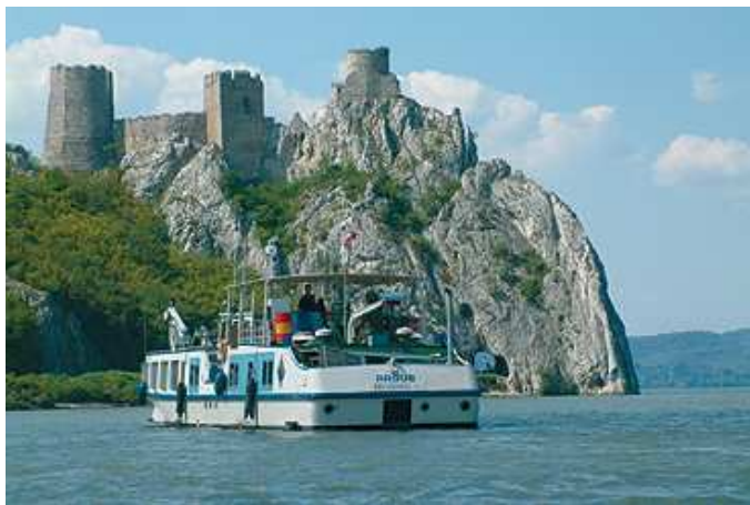
Golubački Grad (Cetatea Golubac)

Clisura Dunării pe teritoriul Serbiei, cu o lungime de cca 100 kilometri lungime (de la Golubac la Tekija), este de fapt o vale compusă din patru sectoare de chei: Gornja Klisura (Clisura de Sus), Gospodin vir (Vârtejul Doamnei), Veliki și Mali Kazan (Cazanele mari și Cazanele mici) și Sipska Klisura (Clisura Sip), separate între ele prin ravene. În Gospodin Vir adâncimea Dunării este 82 m în timp ce albia în zona Cazanelor are o adâncime de până la 150 m. Stâncile de pe canionul din Cazane au o înălțime de aproximativ 300 de metri.