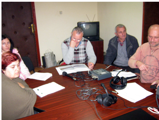
20 noiembrie 2009 - masă rotundă, la Consiliul Local Pojejena, în cadrul campaniei media realizată de Postul Radio Timișoara.

-Infrastructura publică de acces și vizitare în interiorul acestor arii naturale protejate (drumuri, poteci, punți, puncte de informare, locuri de popas și de campare, observatoare pentru păsări și alte animale etc.) este rudimentară iar traseele turistice prezintă un important grad de risc.