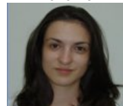
EMILIJABRKLJAC Liceul de Chimie și Medicină Vrsac