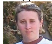
SOFICA CIOSA Liceul „Eftimie Murgu” Bozovici