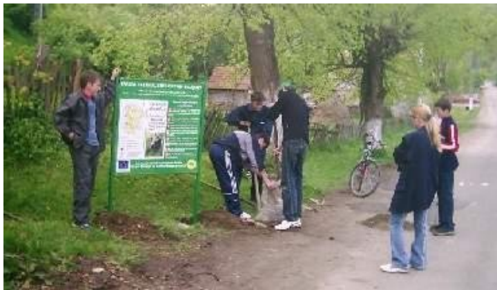
Voluntarii de la școala din Șopotu Nou instalează un panou de informare ecoturistică.

Activitățile care vor fi realizate în anul 2008 de voluntarii ce activează în Centrul transfrontalier de voluntariat al GEC Nera se vor desfășura în zona parcurilor naturale Porțile de Fier, Cheile Nerei – Beuțnița, Deliblatska Pescara (Dunele Deliblato) și Vrsacke Planine (Munții Vârșetului). Activitățile de voluntariat vor fi în special monitorizarea alternativă a mediului și