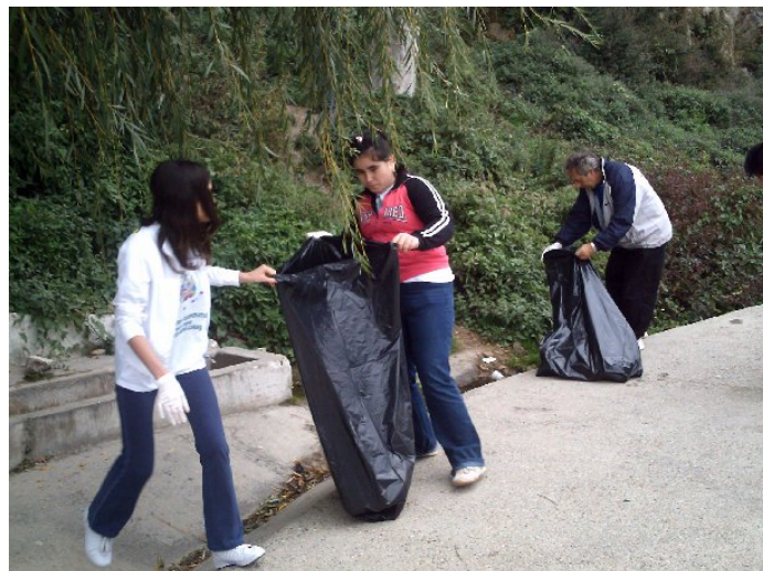
Voluntari de la Liceul de Chimie și Medicină Vrsac realizează igienizarea punctului turistic Gaura cu Muscă de lângă localitatea Coronini

Reamintim colaboratorilor GEC Nera că legitimarea voluntarilor se poate face doar în urma frecventării unui training de specialitate ,ocazie cu care candidații la activități de voluntariat vor fi familiarizați cu specificul activităților pe care urmează să le realizeze. ONG-urile/școlile care doresc să implice voluntari în proiectele ce vor fi implementate de GEC Nera în anul 2008 pot organiza acest training în perioada decembrie 2007 – februarie 2008 . Temele de training vor fi furnizate de GEC Nera. Acestea sunt de nivel mediu și pot fi prezentate de lectori (profesori) de specialitate din cadrul organizațiilor participante.