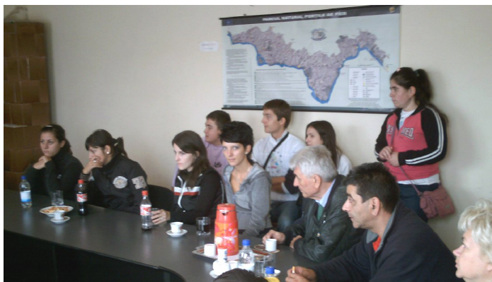
Masa rotundă la Primăria Sichevița privind practicarea ecoturismului în Clisura Dunării