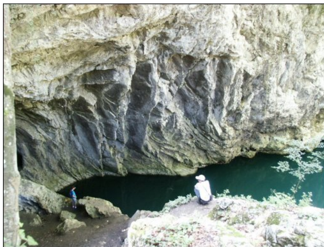
Misterioasa lume de la Lacul Dracului

Galeria lungă de aprox. 70m, este aproape lipsită de formațiuni speologice specifice (stalactite, stalagmite sau coloane), dar este foarte înaltă și ne conduce prin mici săritori la balcoane care se deschid deasupra apei, oferind o minunăție priveliște, vizitatorului.