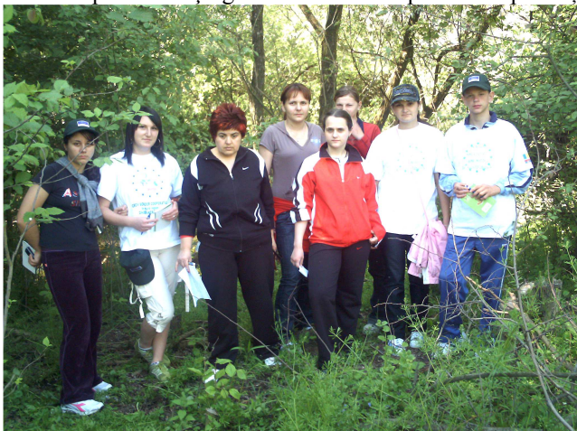
Misiune de monitorizare a rezervației Balta Nera – Dunăre de către echipa de voluntari Porțile de Fier de la Grupul Școlar Industrial Moldova Nouă

Prezentările au prefațat lansarea sezonului ecoturistic iunie - septembrie 2008, perioada în care voluntarii GEC Nera vor realiza activități de monitorizare alternativă a stării ecologice a celor două parcuri naturale, informare a populației și turiștilor privind regulamentul parcurilor și igienizarea a ariilor speciale de protecție.