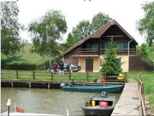
Punct de informare în zona umedă (Ramsar) Labudovo Okno

Problemele din delta Nerei nu se opresc numai la „muzeul” PET-urilor din Europa.