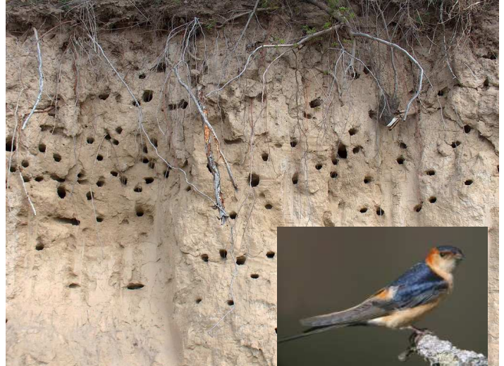
Lăstunii au spus Adio ! coloniei de la Valea Divici

Voluntari ai Grupului Ecologic de Colaborare Nera împreună cu agenții ai Administrației Parcului Natural Porțile de Fier au realizat în comun, în data de 10 mai a.c, o monitorizare a stării ecologice a factorilor de mediu și a biodiversității în Clisura de Sus a Dunării, pe teritoriul comunelor Pojejena și Socol, acolo unde sunt amplasate ariile speciale de protecție Pojejena – Divici (zonă umedă), Insula Calinovăț (zonă umedă), Râpa cu Lăstuni – Valea Divici (rezervație avifaunistică), Baziaș (rezervație forestieră) și Balta Nera – Dunăre (zonă umedă).