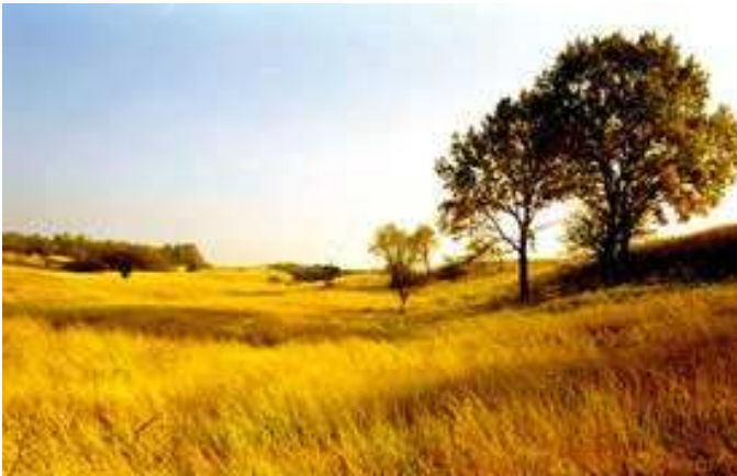
Stepa din Deliblatska Peșčara

Rezervația Deliblatska Peșčara cuprinde aproape 35.000 hectare de teren în care este aplicat un regim de protecție pe trei nivele.