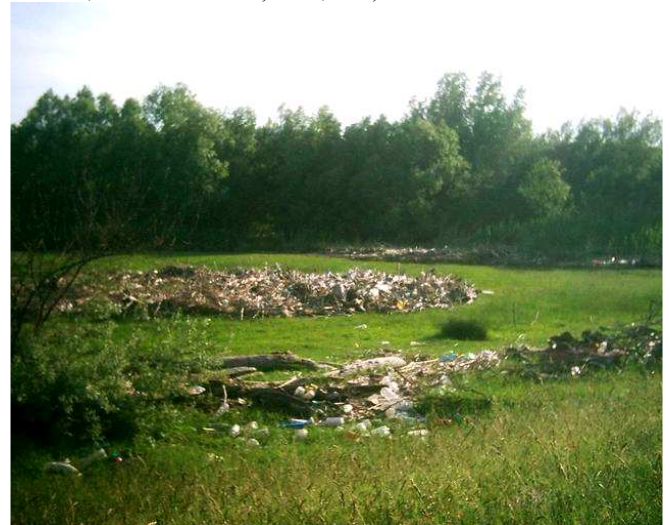
„Muzeul” PET – urilor din Europa la Km 0 al Dunării românești

Ramsar, managementul zonei umede Labudovo Okno este susținut financiar, în mod generos, din fonduri ONU, fapt care a permis subvenționarea comunităților locale, în special a agricultorilor pentru practicarea unor activități ecologice în zonele II și III de protecție și pentru dezvoltarea infrastructurii de practicare a turismului (poteci tematice, observatoare pentru păsări și animale, sistem informațional, etc.).