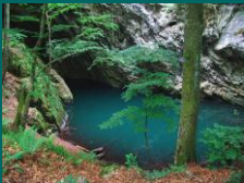
Toamnă la Lacul Dracului