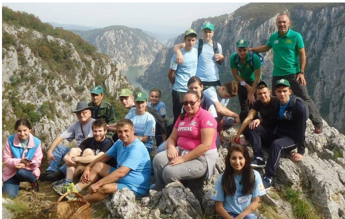
Pe Ciucarul Mare

GEC Nera, în cooperare cu liceele GENERAL DRAGALINA din Oravița și MATHIAS HAMMER din Anina, a organizat la 1 octombrie 2016 o monitorizare a mediului pe Dunăre și promovarea ecoturismului, în zona comunelor Coronini, Sichevița, Berzasca, Șvinița și Dubova. Cu această ocazie voluntarii au întocmit rapoarte de monitorizare și au făcut prezentări turistice la Tabula lui Baross Gabor de la Coronini, Cetatea Tricule de la Șvinița, Mănăstirea Mraconia și capul sculptat în stâncă a regeului dac Decebal de la Valea Mraconiei.