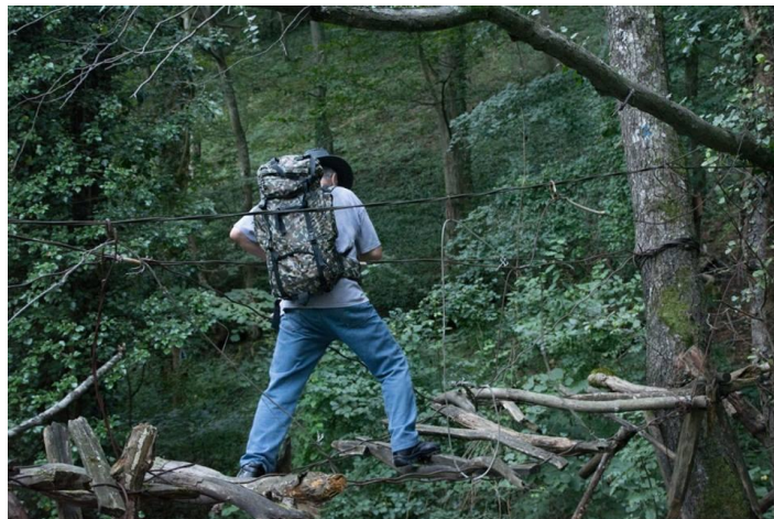
“Puntea” de la Prolaz

Zonele de sălbăticie sunt acele zone în care patrimoniul natural nu a fost deranjat, sau a fost foarte puțin deranjat, prin activități umane. În interiorul parcurilor naționale, de obicei, acestea sunt incluse în zonele de strictă protecție definite prin planul de management al parcului.