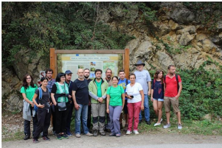
10 septembrie 2016 cu De-Click pe Nera

Petiția este semnată și de către GEC Nera și a fost lansată în data de 8 Februarie 2016, înaintea consultării publice de la Prigor a studiului de impact privind emiterea acordului de mediu de către Agenția pentru Protecția Mediului Caraș – Severin în legătură cu perspectiva construirii a 2 minihidrocentrale pe râul Nera în această zonă.