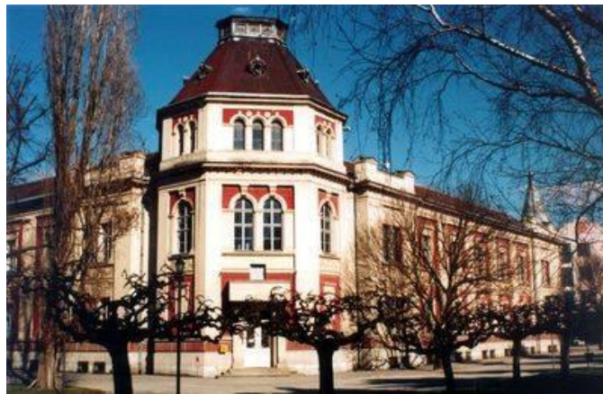
Clădirea Primăriei Veliko Gradište

jeste). Cele trei cuvinte au format ulterior numele orașului.