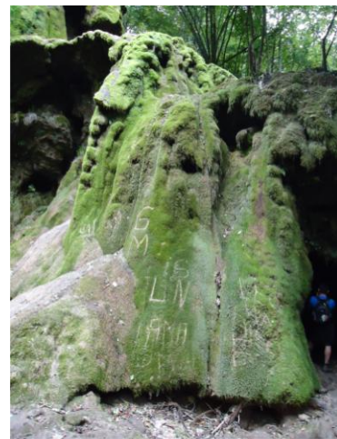
Cascada Beușnița, septembrie 2016

Un fenomen natural dar a cărui efect asupra cascadei trebuie prevenit atunci când este posibil deoarece normal și natural este ca să curgă apă peste o cascada cum este Beușnița, care este o adevărată emblemă a lumii mirifice a parcurilor din sudul Banatului iar pentru vizitarea ei se percepe o taxă de vizitare.