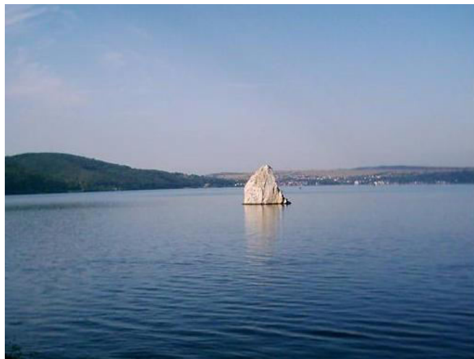
Stânca Baba Caia

apei. Stânca este în continuă degradare datorită ploilor, zăpezilor și fenomenelor îngheț - dezgheț, motiv pentru care autoritățile ar trebui să ia măsuri de protecție deoarece această stâncă este simbolul Clisurii de Sus a Dunării.