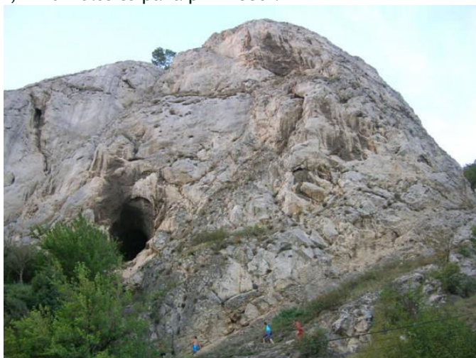
Peștera Gaura cu Muscă

Peștera este în lungime totală de 254 m și a luat naștere prin infiltrarea apei în roca de tip calcaros. A fost locuită încă din perioada neolitică fiind un adăpost ideal pentru omul primitiv. Poziția ei, cu intrarea prin care domină Dunărea a făcut ca în epoca medievală să fie fortificată și echipată cu tunuri, având și o mică garnizoană de soldați. Astăzi se mai văd fortificațiile de la intrare făcute încă din anul 1460 și refăcute de mai multe ori, fiind folosite până prin 1880.