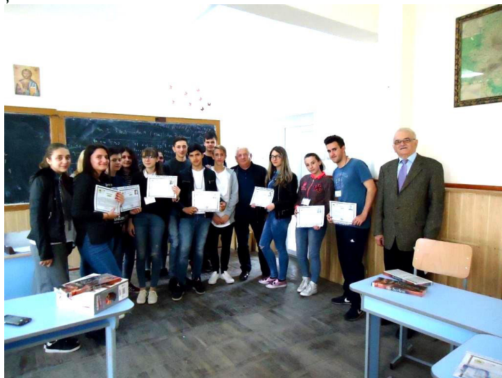
Acordare de certificate de absolvire a cursului de agent ecologic voluntar la Liceul Tehnologic CLISURA DUNĂRII din Moldova Nouă

Grupul Ecologic de Colaborare Nera a acordat în data de 18 aprilie a.c. certificatele de absolvire a cursului de agent ecologic voluntar, o activitate extracurriculară desfășurată în perioada decembrie 2017 - martie 2018 în parteneriat cu liceele CLISURA DUNĂRII din Moldova Nouă și MATHIAS HAMMER din Anina.