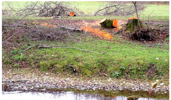
Tăieri pe râul Caraș în aval de localitatea Goruia

În răspunsul CJCSGNM se precizează că în anul 2017 nu a efectuat controale în SCI ROSCI0226 Semenic - Cheile Carașului. Ulterior instituția nu a mai furnizat în termen legal informațiile cerute de GEC Nera prin scrisoarea 2812/.03.01.2018.